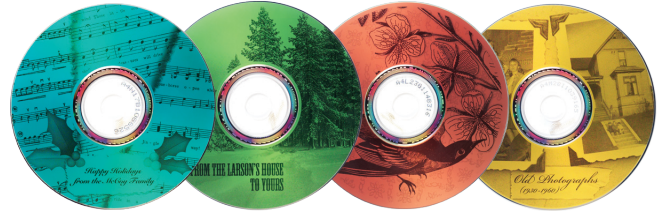
Étiquetage facile de CD/DVD LightScribe